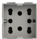
cod. 4B.NT.H21 tech