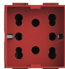
cod. 4B.LR.H21 rossa